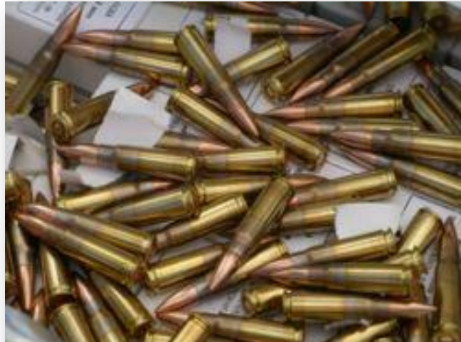
Munitions de calibre 7,62 mm M43, notamment utilisées pour alimenter les célèbres AK-47

Les armes conventionnelles ne seraient rien sans leurs munitions. Beaucoup d'États se sont prononcés en faveur d'un Traité sur le commerce des armes couvrant également les transferts de munitions associées. Le rôle des munitions est crucial dans le déclenchement, la prolongation et/ou l'intensification des conflits armés. Leur disponibilité influence directement les stratégies de combat et le nombre de victimes. Dans certains cas, la raréfaction des munitions peut même conduire les combattants à leurs armes.