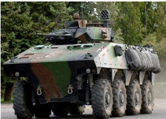
Véhicule blindé de combat

Dans sa résolution de 1991 sur la transparence dans le domaine de l'armement, l'Assemblée générale demande aux États de fournir annuellement des informations sur leurs exportations et importations d'armes conventionnelles. Sept catégories d'armes conventionnelles ont été définies : les systèmes d'artillerie de gros calibre, les avions de combat, les chars de combat, les hélicoptères d'attaque, les véhicules blindés de combat, les navires de guerre et, enfin, les missiles et les lanceurs de missiles 2 .