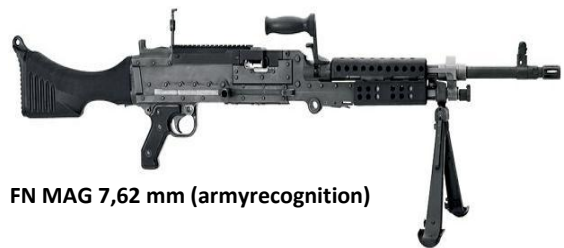
FN MAG 7,62 mm (armyrecognition)

Une analyse des rapports fournis en 2009 dans le domaine des transferts d'ALPC est évocatrice de la faiblesse de la participation belge au Registre. C'est la première fois que la Belgique soumet des informations sur ses transferts d'ALPC alors que les États sont invités à le faire depuis 2003. Comme l'annexe 1 le montre, elle ne signale qu'une exportation de 55 mitrailleuses légères MAG 7,62mm vers l'Uruguay pour l'année 2008 22 . Il s'agit vraisemblablement de mitrailleuses montées sur des véhicules blindés vendus par le pouvoir fédéral à l'Armée uruguayenne 23 . Cependant, l'analyse des rapports des autres États, reprise dans l'annexe 2, renseigne sur davantage de transferts impliquant la Belgique. Dix-sept États mentionnent trente-trois exportations d'ALPC en provenance de la Belgique. Aussi, il semble invraisemblable qu'elle n'ait exporté des ALPC qu'à l'Uruguay pour l'année civile 2008. Plus largement, l'ensemble des informations fournies par la Belgique au Registre sur ses exportations d'armes conventionnelles pour l'année civile 2008 concernent vraisemblablement exclusivement des transferts effectués au niveau fédéral 24 .