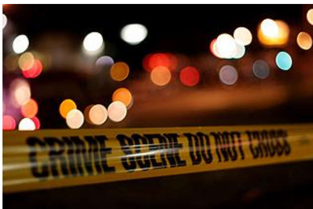
« Crime scene do not cross » (Howard County)